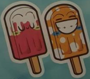
Ideāls vasaras desertis!

ZĪMĒ TĒRPUS UN TIEC PIE DĀVANU KARTES NO RESERVED!