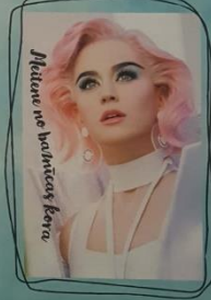
Mēģini ne kaudzētās ķerā